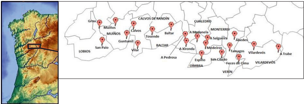
Imaxe 1. Puntos de enquisa

pertencen, polo tanto, a vinte e unha localidades rurais dos concellos de Lobios, Muíños, Calvos de Randín, Baltar, Cualedro, Monterrei, Oímbra, Verín e Vilardevós; todas elas de menos de 400 habitantes (ver Anexo 1). Aínda que na maior parte destas entidades municipais se realizaron dúas entrevistas, nos concellos de Calvos de Randín, Monterrei e Verín efectuáronse tres (no primeiro caso, pola facilidade para atopar alí un informante que realizase a gravación de proba; nos outros, por tratarse dos dous concellos que contan con maior número de habitantes).