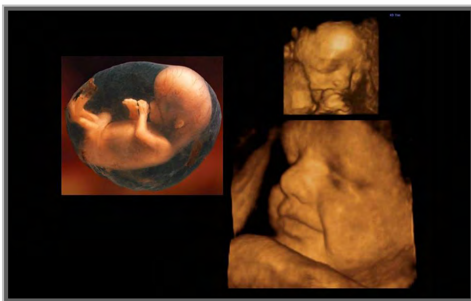
Figura 1. Algunas imágenes proyectadas durante la presentación de una de las ediciones de la actividad de ABP denominada "Liga Odontopediátrica".