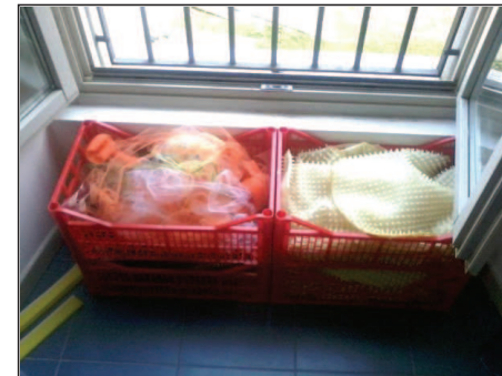
Fotografía 1. Teas e plásticos en caixas

Clasificouse o material acumulado nas caixas que foran recollidas no mercado e ordenouse a aula. Procurouse colocar as caixas (co material dentro) arredor da aula pegadas ás paredes para non ocupar o espazo central da aula, así como tamén non mesturar os materiais: en cada caixa tiña cabida só un tipo de material, sen mesturar varios na mesma. Ademais, en cada zona os materiais incluídos nas caixas debían ser das mesmas cores na medida do posible. Amósanse a continuación algunhas fotografías da disposición dos materiais na aula.