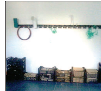
Fotografía 2. Material de refugallo industrial en caixas e colgado no colgadoiro