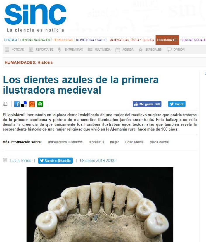
Fig. 2. “Los dientes azules de la primera ilustradora medieval”, en Servicio de información y noticias científicas (SINC). 2019-01-09. Consulta: 21-03-2019. Disponible en: https://www.agenciasinc.es/Noticias/Los-dientes-azules-de-la-primera-ilustradora-medieval