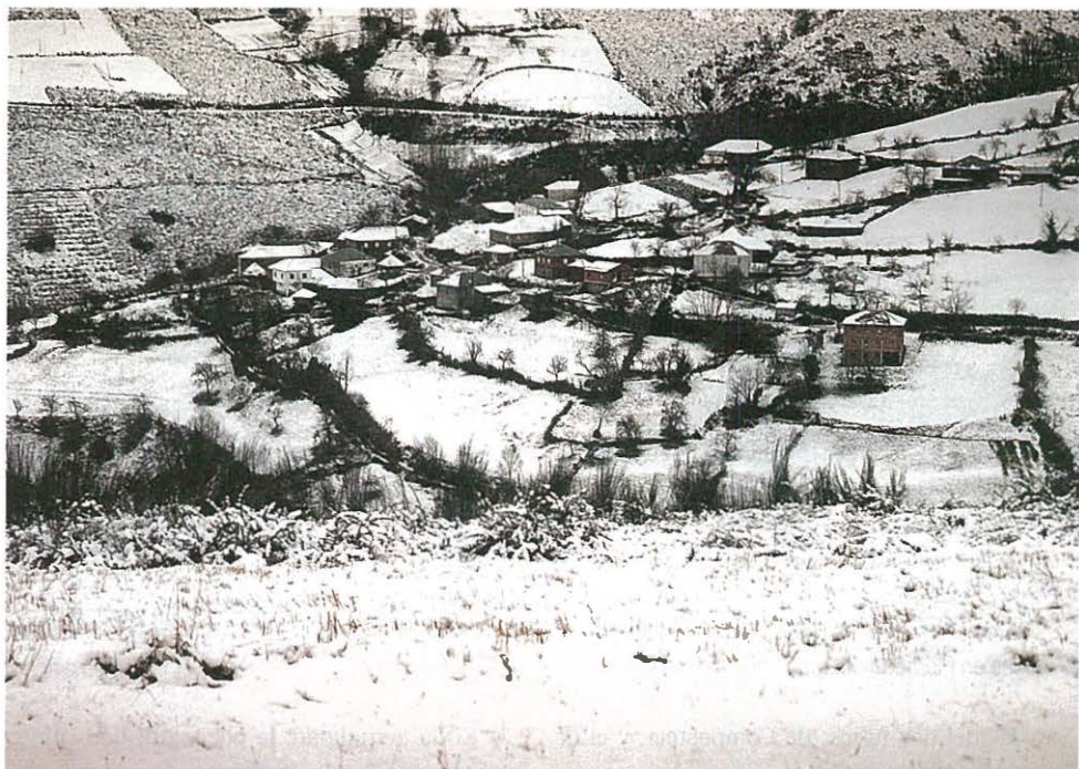
Montes nevados en la Serra dos Ancares

abarcan, en su vertiente occidental, casi la totalidad del municipio.