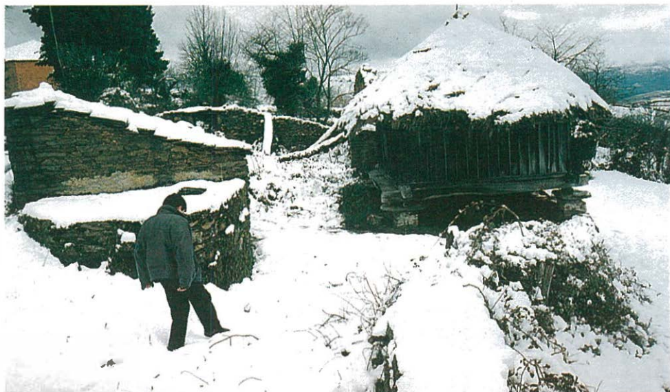
Pallozas en Piornedo cubiertas por la nieve

San Miguel dos Agros, de Compostela, y el de los condes de Granjal.