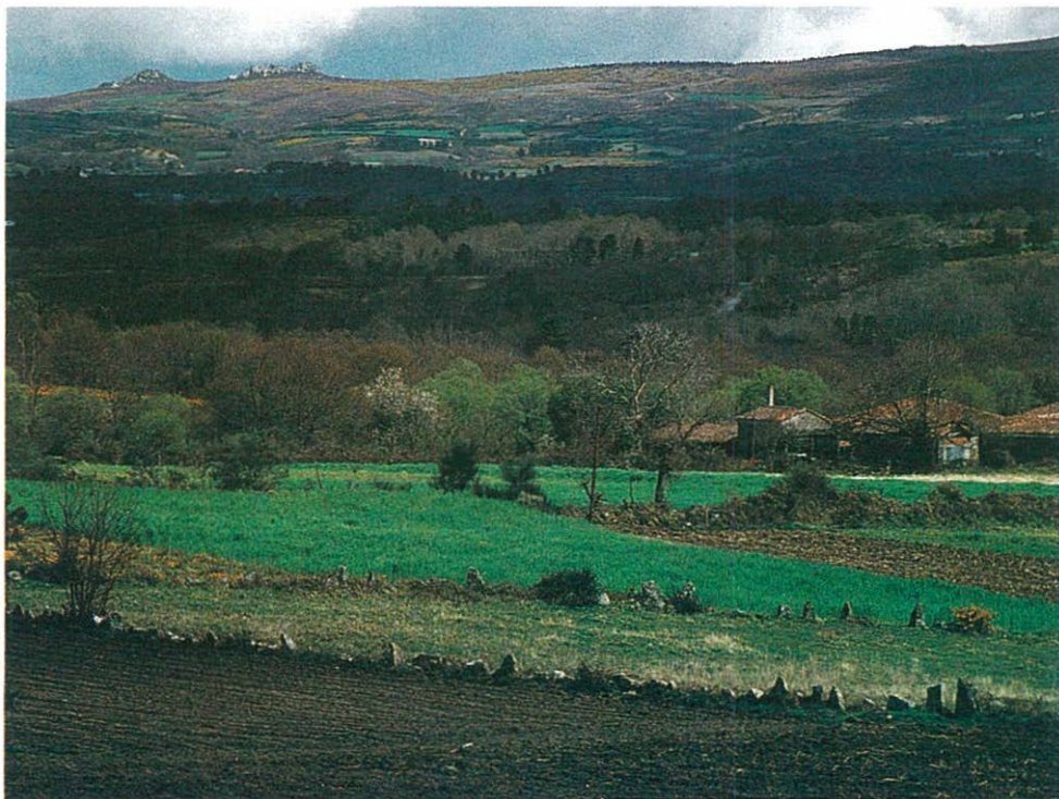
En la imagen, uno de los numerosos valles que se pueden contemplar Os Ancares

Como exponente de la arquitectura popular, en algunas aldeas, sobre todo en Piornedo, se conservan numerosas “pallozas”. Se trata de viviendas prerromanas de origen celta que hasta muy poco eran habitadas por los campesinos del propio lugar, donde, recientemente, se ha construido un hostel.